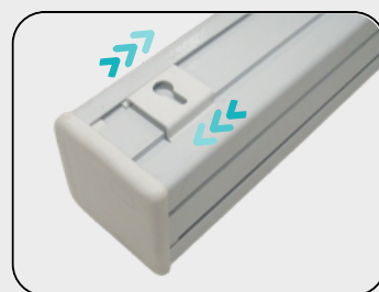
Suporte com Trilho Correção