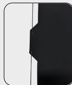
Tensionamento nas laterais do tecido